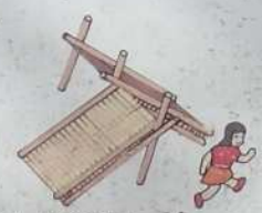
わんぱくスロープ