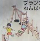
ブランコ付 わんぱく滑り